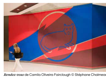
Rendez-vous de Camila Oliveira Fairclough

2 Place Sainte-Anne La commande d'art public à Rennes