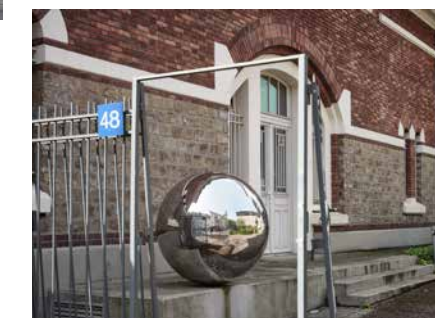
© Christophe Le Dévéhat - Rennes Ville et Métropole

13 Œuvre sans titre de Yann Lestrat Sculpture en acier inoxydable poli, 2013