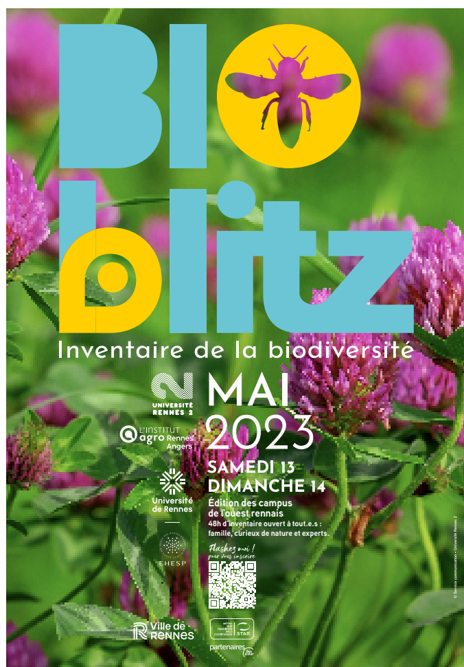
Affiche de l'édition 2023 du « Bioblitz »

→ Leviers d'action identifiés : s'appuyer sur la dynamique des Champs Libres et de l'Espace des sciences pour rendre accessibles les avancées et résultats de la recherche locale, encourager les publications des supports existants (magazine Science Ouest...), donner la parole aux chercheurs dans les supports de communication de Rennes Métropole, encourager les acteurs des projets de recherche ou expérimentaux à reconsidérer le caractère essentiel, a fortiori dans un univers mondialement connecté, de la communication et de la diffusion, etc.