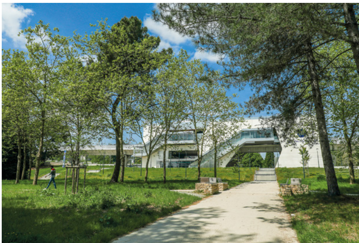
Abords de la station du métro Beaulieu-Université, ligne b

Elle tient compte, enfin, des orientations stratégiques européennes et nationales pour l'ESR ainsi que des orientations de la Stratégie régionale des transitions économiques et sociales, qui intègre le nouveau Schéma régional de l'enseignement supérieur et de la recherche.