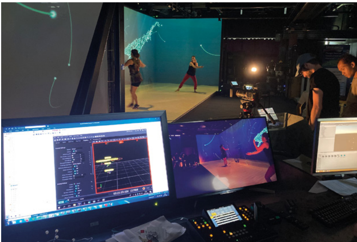
Plateforme de recherche de réalité virtuelle Immersia, IRISA/Inria

→ Leviers d'action identifiés : encourager les mobilités internationales, soutenir l'organisation de colloques internationaux, etc.