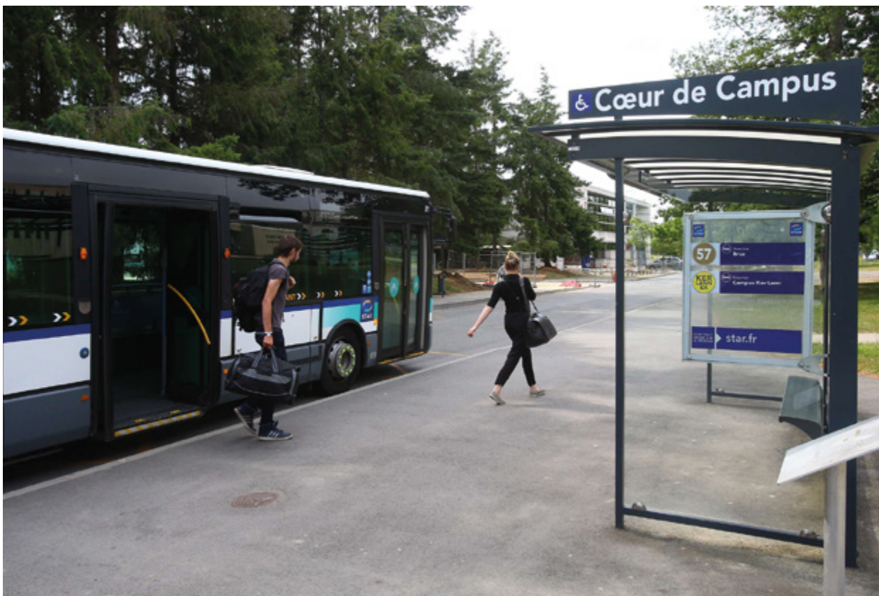
Campus de Ker Lann

→ Leviers d'action identifiés : contribuer à favoriser la mixité des usages sur les campus et en faire des lieux de vie, co-animer des réflexions collectives permettant d'articuler les stratégies de développement des établissements avec ses politiques d'aménagement, contribuer aux démarches de co-construction de principes d'organisation spatiale et de scénarios d'évolution des campus, déployer des dispositifs visant à activer la relation science & société, etc.