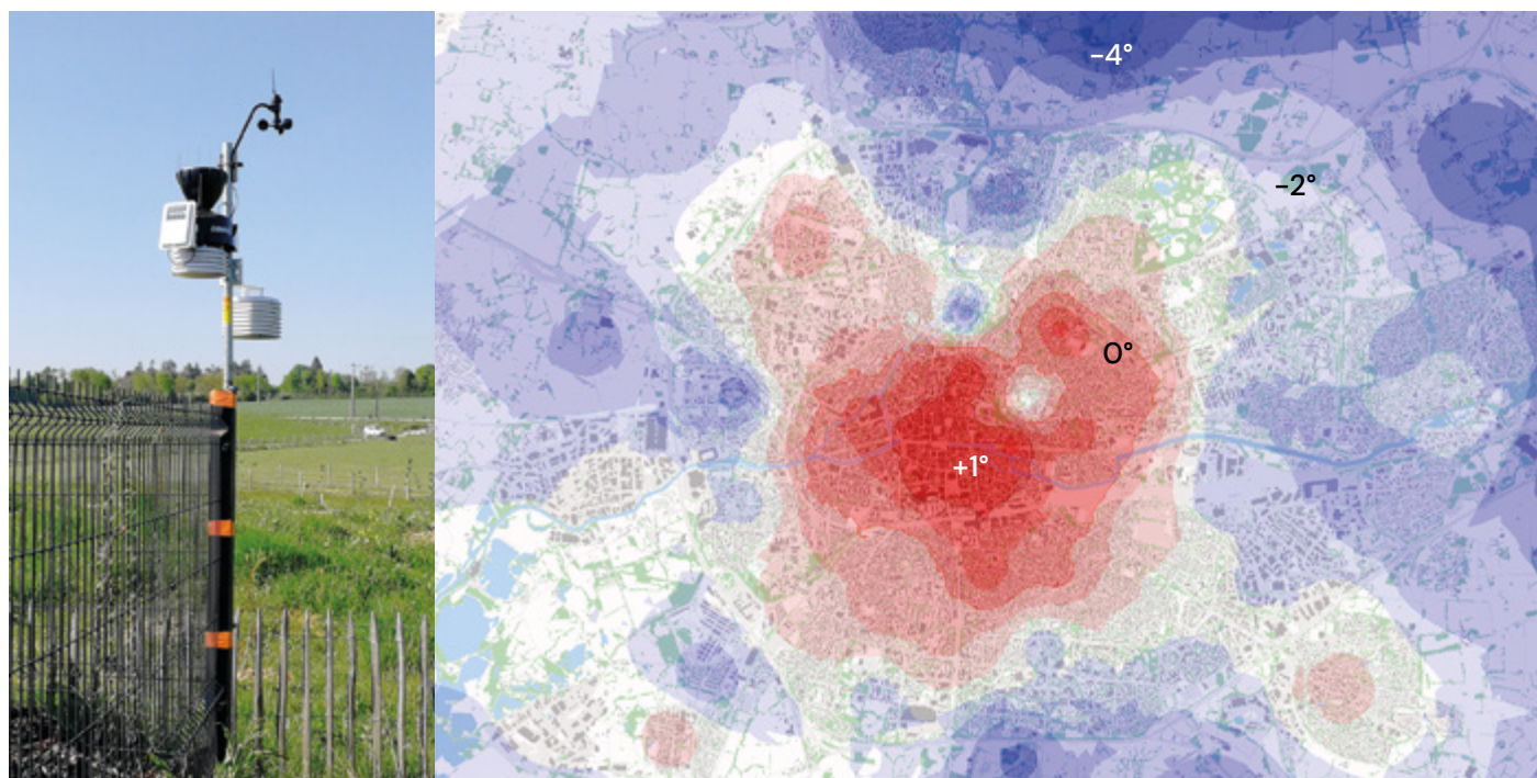
Travaux de recherche menés par le laboratoire LETG sur le suivi des îlots de chaleur urbains à Rennes (projet Rennes Climate Urban Network) - station de mesure in-situ (à gauche) et carte de la température minimale du 4 avril 2022 (à droite)

Elle développera à cette occasion un outil nouveau, les « Chaires de recherche à impact » (CRI) qui pourront agréger, autour d'une thèse CIFRE, de l'aide à l'acquisition d'équipements scientifiques ou encore des crédits de fonctionnement.