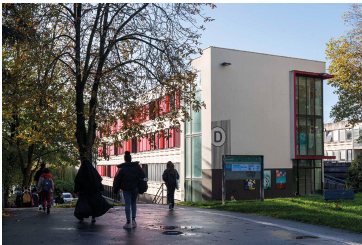
Bâtiment D, Université Rennes 2, Campus Villejean

→ Leviers d'action identifiés : encourager la mise en réseau des bibliothèques universitaires et l'adaptation des lieux d'apprentissage aux nouvelles pratiques des étudiants (travail individuel, collectif, en téléprésence...), soutenir les démarches expérimentales en recherche et en formation au travers d'occupations transitoires et éphémères, etc.