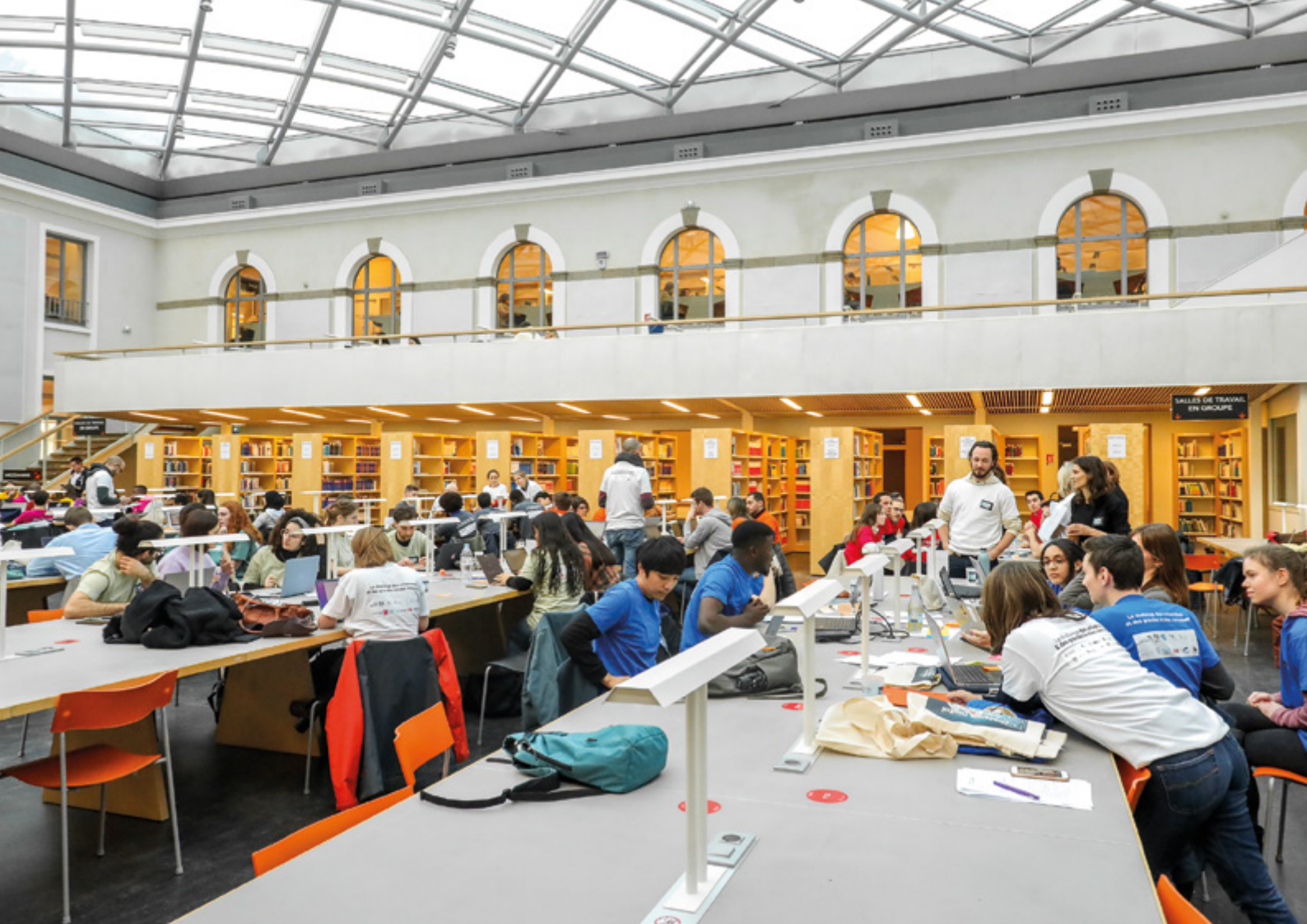
Bibliothèque universitaire « La Borderie », challenge étudiant Digital Transformer 2023