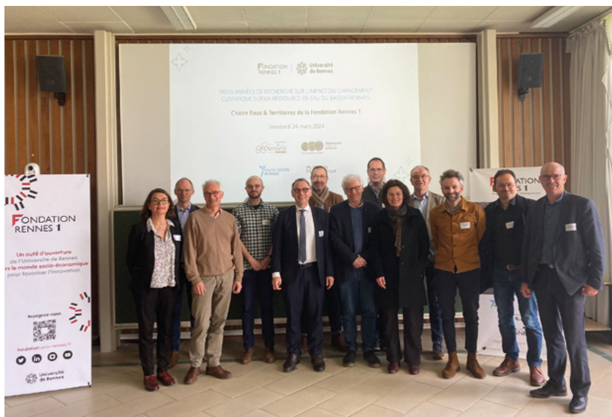
Évènement de clôture de la chaire de recherche et de formation Eaux et Territoires - Fondation Rennes 1

L'urgence climatique et les enjeux de lutte contre les inégalités (sociales, d'accès aux ressources, etc.) doivent traverser l'ensemble de nos réflexions et exigent de nous autant d'attention que d'efforts, que l'on soit élu, agent public, étudiant, chercheur ou citoyen. À travers sa Politique Enseignement Supérieur, Recherche et Innovation , Rennes Métropole souhaite mobiliser l'ensemble des forces créatives, ingénieuses et savantes du territoire afin de se rassembler derrière un projet commun, fédérateur, permettant de répondre aux enjeux des transitions. « Faire ensemble » n'est pas une option, c'est un impératif.