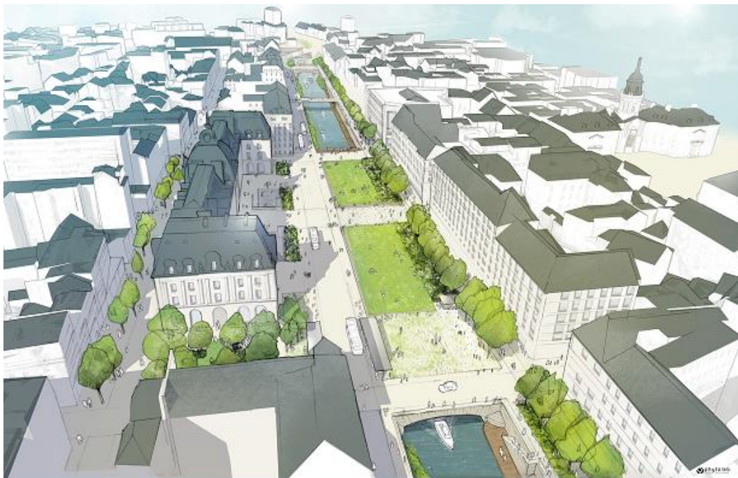
Vue générale du projet (phytolab)

Missionné pour réfléchir au devenir des ouvrages de couverture de la Vilaine, un jury citoyen avait présenté ses travaux lors du conseil municipal du 17 janvier 2022. Le scénario qu'il préconisait, "la Vilaine au Cœur de Rennes", prévoyait la suppression de la dalle du parking Vilaine et la découverte du fleuve à cet emplacement. Le périmètre de son étude comprenait l'ensemble des ouvrages de couverture (parking Vilaine et place de la République) et les quais associés (Duguay-Trouin, Lamartine, Chateaubriand, Lamennais, Émile-Zola).