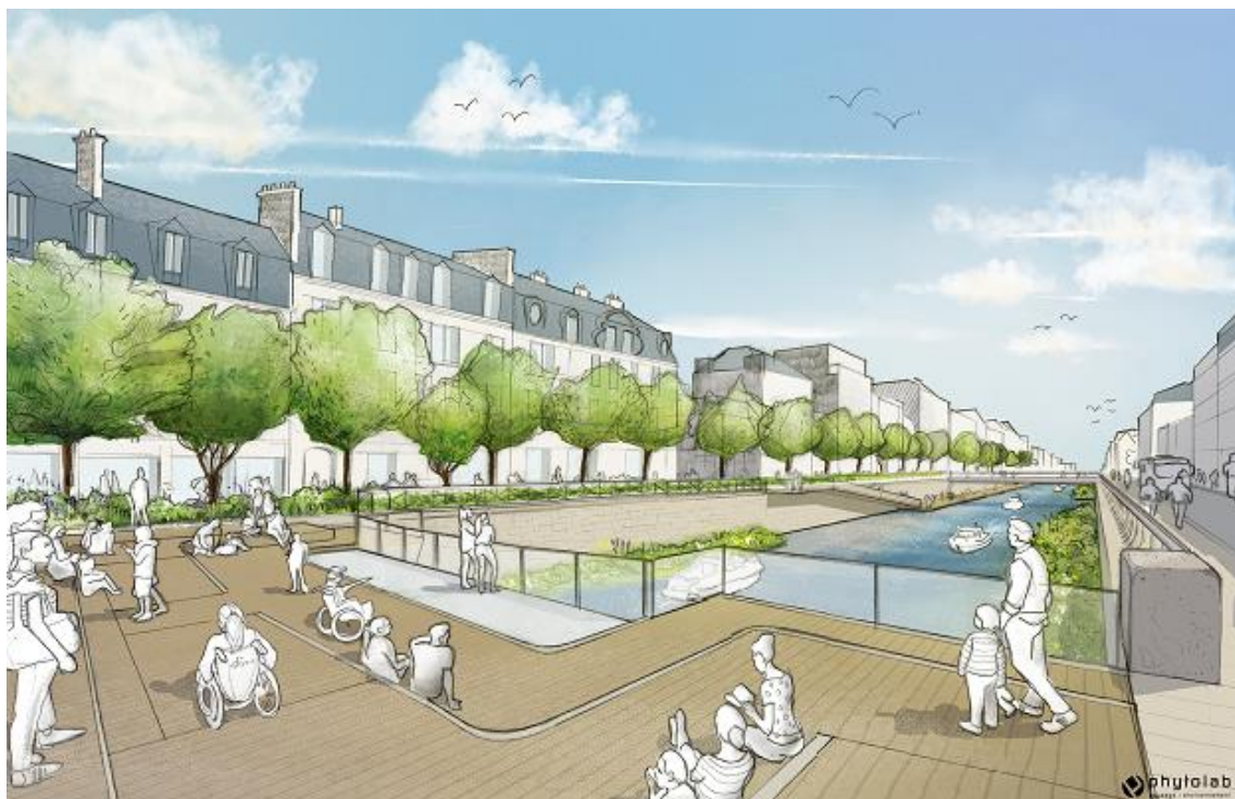
Croquis des gradins, place de Bretagne (phytolab)

Le nombre de jardins flottants sera augmenté, afin d'accroître la biodiversité du site et atténuer le caractère minéral des quais.