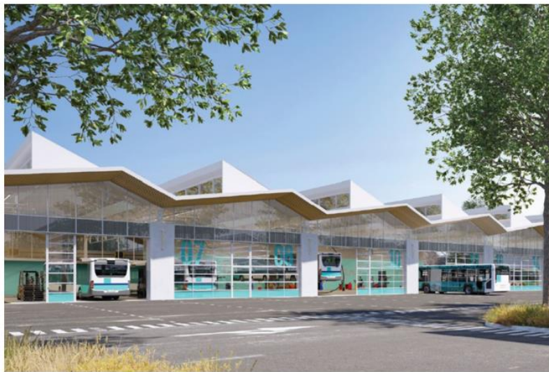
Façade ouest de l'atelier de maintenance – projet BLP & Associés

L'enveloppe financière de l'opération est de 33,3 M€ HT (valeur décembre 2019) et se décompose en 24,8 M€ de travaux et 8,5 M€ d'études (maitrise d'œuvre, études environnementales), de déconstruction de l'actuel dépôt, et d'aléas.