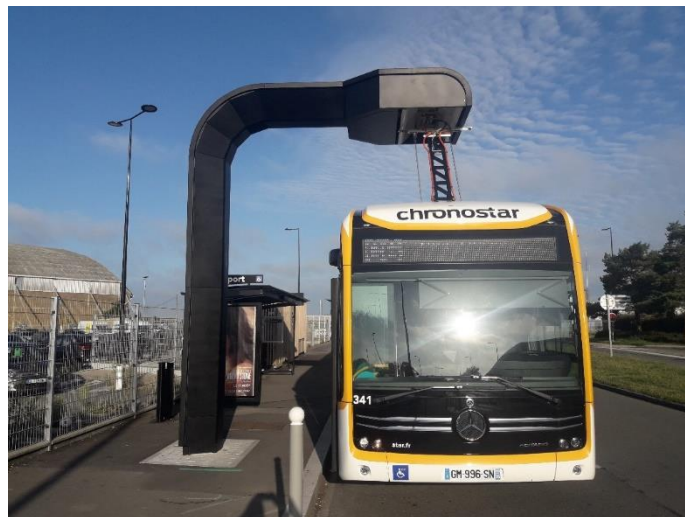
Mât de recharge au terminus Aéroport ligne C6