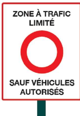
Le panneau d'entrée dans la ZLT

Apparue dans les années 1970 en Italie, plusieurs métropoles françaises ont instauré ou expérimentent des ZTL. Rennes rejoint ainsi Nantes, Bordeaux, Grenoble, Strasbourg... Par sa surface (40 hectares) et son échelle (un quartier entier), Rennes se distingue par son ambition en créant un vaste espace apaisé.