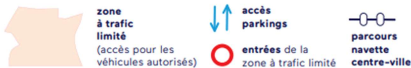
Le plan de la ZTL