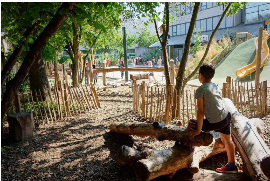
Cour réaménagée de l'école Marie-Pape-Carpentier

De nouveaux chantiers seront ouverts à l'été 2024 dans les cours des écoles élémentaires Jean-Rostand (Longs6Champs), Camille-Claudé (Fougères-Sévigné), Andrée-Chédid (Villejean).